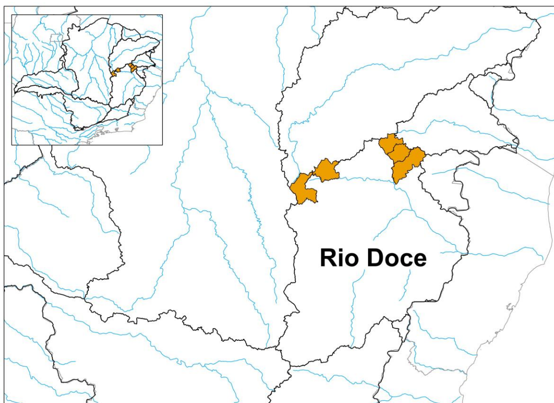
Figura 2: Localização dos municípios que solicitaram decreto de situação de emergência

De acordo com o boletim da Defesa Civil os municípios que solicitaram decreto de situação de emergência foram 167, sendo que na Bacia do Rio Doce foram 5 , conforme figura e tabela abaixo.